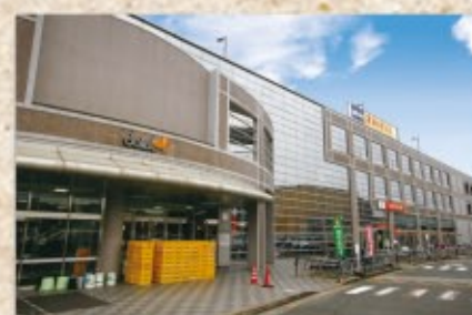
ダイエー 徒歩約7分