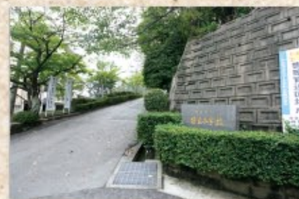
笹丘小学校 徒歩約4分