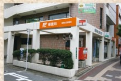
笹丘郵便局 徒歩約4分